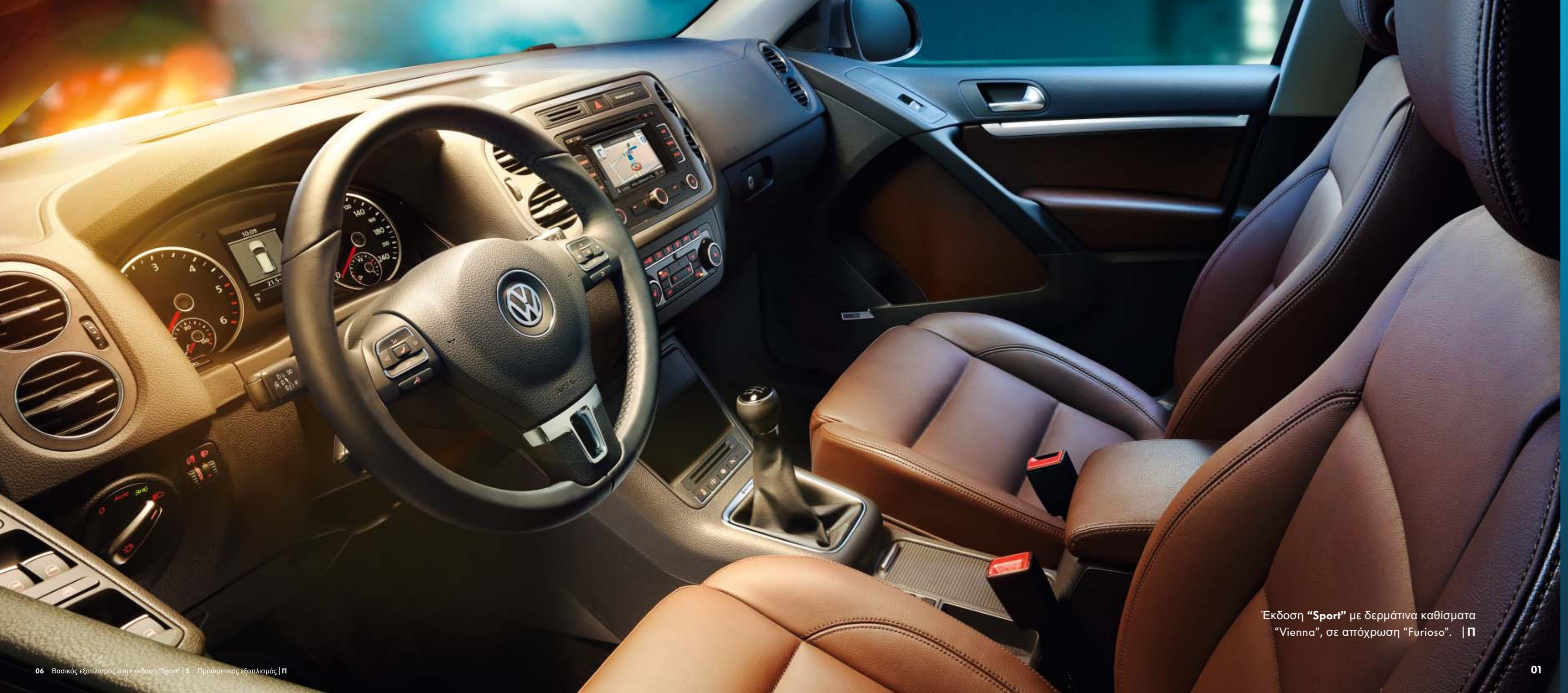
Έκδοση "Sport" με δερμάτινα καθίσματα "Vienna", σε απόχρωση "Furioso". | Π