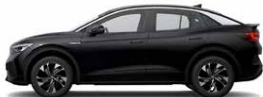
Μαύρο Myth Μεταλλικό Προαιρετικός εξοπλισμός