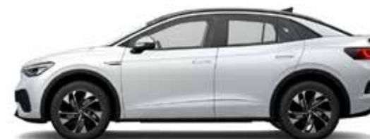
Λευκό Glacier/Μαύρο, Μεταλλικό Προαιρετικός εξοπλισμός