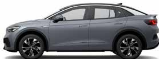
Γκρι Moonstone Βασικός εξοπλισμός