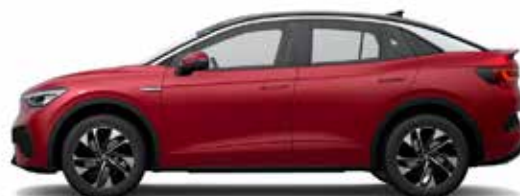
Κόκκινο Kings/Μαύρο, Μεταλλικό Προαιρετικός εξοπλισμός