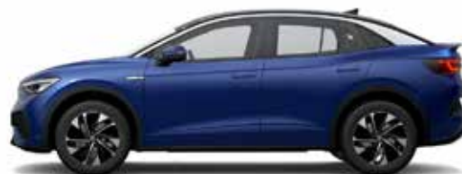
Μπλε Dusk/Μαύρο, Μεταλλικό Προαιρετικός εξοπλισμός