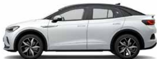
Λευκό Glacier/Μαύρο, Μεταλλικό Προαιρετικός εξοπλισμός