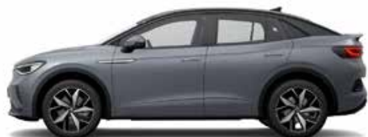
Γκρι Moonstone Βασικός εξοπλισμός