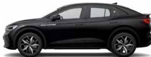
Μαύρο Myth Μεταλλικό Προαιρετικός εξοπλισμός