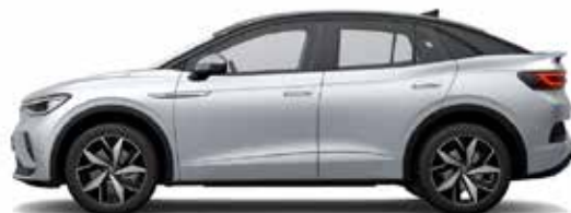
Ασημί Scale/Μαύρο, Μεταλλικό Προαιρετικός εξοπλισμός