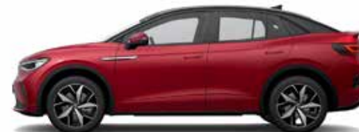
Κόκκινο Kings/Μαύρο, Μεταλλικό Προαιρετικός εξοπλισμός