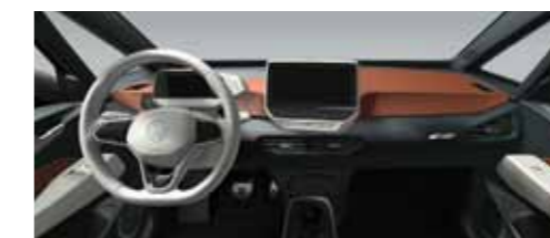
Εσωτερικό Πορτοκαλί Safrano/Λευκό Electric 4