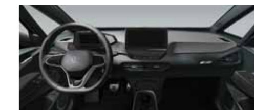
Εσωτερικό Γκρι Dusty Dark/Μαύρο Piano