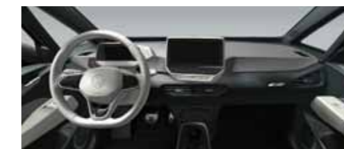
Εσωτερικό Γκρι Dusty Dark/Λευκό Electric