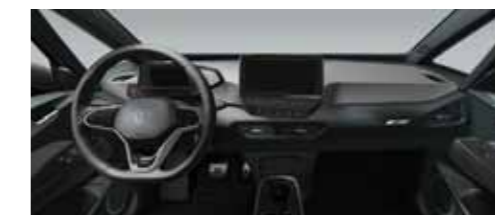
Εσωτερικό Γκρι Dusty Dark/Μαύρο Piano