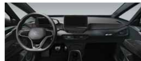
Εσωτερικό Γκρι Platinum/Μαύρο Piano