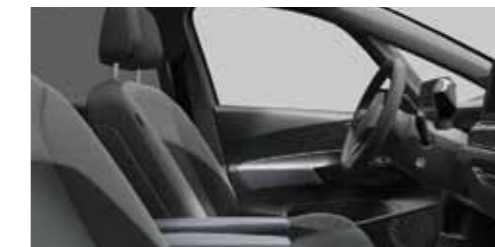
Interior Style Γκρι Platinum/Γκρι Dusty Dark Ξεχωρίζει χάρη στον μοναδικό σχεδιασμό