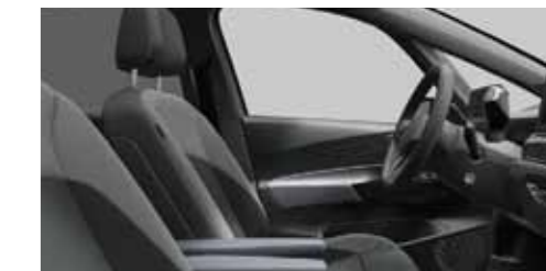
Interior Style «Plus» Γκρι Platinum/Γκρι Dusty Dark Υψηλή άνεση με ηλεκτρικά ρυθμιζόμενα καθίσματα