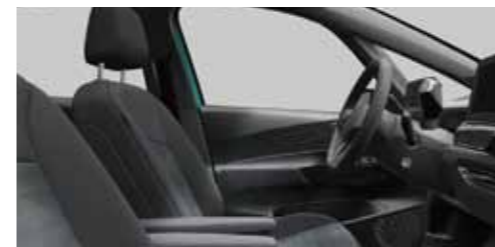
Βασικές επενδύσεις καθισμάτων Γκρι Platinum/Soul